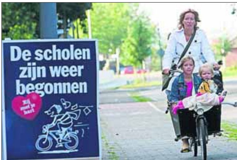
Zouden al die snelheidspiraten onmiddellijk op de rem trappen?

Een simpel, goedkoop en effectief plan. Helaas kwam mijn zontje met iets heel anders thuis. Hij torste een oranje rugzak met daarin een aantal glossy folders. Van het project Schoolzone. Wat hebben ze ontdekt? Dat het rond de Nederlandse scholen onveilig is! Goh!